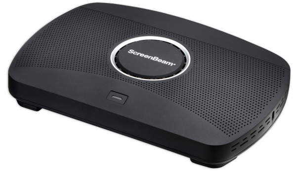
KATALOGNUMMER SBWD1100P ScreenBeam 1100 Plus Drahtloser Display-Receiver mit ScreenBeam CMS

Moderator und Host-Geräte haben verschiedene Verbindungsmöglichkeiten, einschließlich Miracast™, lokaler WLAN-Modus, und Netzwerk-Infrastrukturen. Die neue HDMI-Eingabe verringert die Komplexität des Konferenzraumes und die Kosten durch die Beseitigung von unnötiger Ausrüstung und erleichtert gleichzeitig den Anschluss und die Anzeige für alte Geräte ohne drahtlose Anzeigefähigkeit. Windows und macOS-Nutzer können Inhalte sowohl in duplizierten als auch erweiterten Bildschirmmodi gemeinsam nutzen.