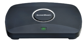
ScreenBeam 1100 Plus 軟體隨ScreenBeam 1100 Plus免費提供，無需授權費用

ScreenBeam Conference 軟體可將會議室的攝影機、麥克風和喇叭以無線方式連接到會議主持人的設備*。使用者可以通過他們的筆記型電腦和所選的統一通信 (UC) 會議服務，參加預定的或臨時的會議，充分利用會議室的週邊設備。ScreenBeam Conference 軟體可有效避免接觸，實現更加安全的會議體驗。